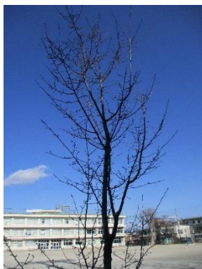
(記念植樹オカメザクラ)

まだ、寒さが続いています、少しずつ春に向けての様子が見られます。校庭では、創立150周年のときに記念植樹した「オカメザクラ」「ジンダイアケボノ」が育ち、小さな芽が出てきています。背丈も伸びて、ぐんぐん成長しています。桜も子どもたちとともに、成長をしています。また、福生市の花いっぱいコンテストでは優良賞を受賞しました。環境委員が取り組んでいるものです。学校に来られた際は、是非、ご覧ください。