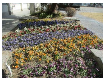
(福生市花いっぱいコンテスト優良賞受賞)